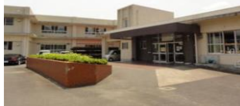
石見養護学校教室棟

支援の必要な消費者へのアプローチは未然防止や早期解決の観点からも消費者教育の充実が欠かせません。また具体的な形にするためには消費者行政のあり方にも着目する必要があります。各地での様々な取組みを共有できるよう私も力を尽くしたいと考えています。