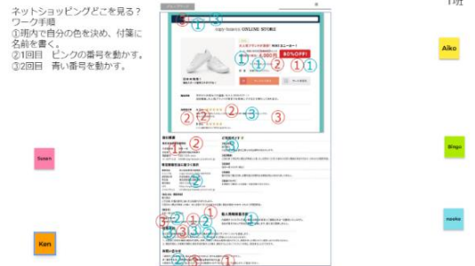
Jam ボードを使ったワーク

2時間目は現役の消費生活センターの相談員と生徒による定期購入の模擬相談を行いました。実践しながらのロープレが非常に効果的で、この後説明した消費生活センターの役割や、法律の意義の話が非常に伝わりやすかったと思います。