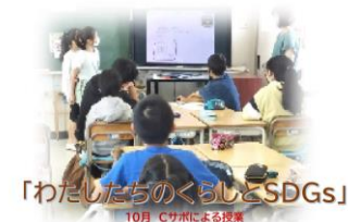
「わたしたちのくらしとSDGs」 10月 Cサポによる授業